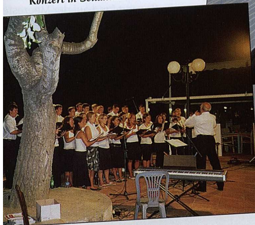
Konzert in Selianitika