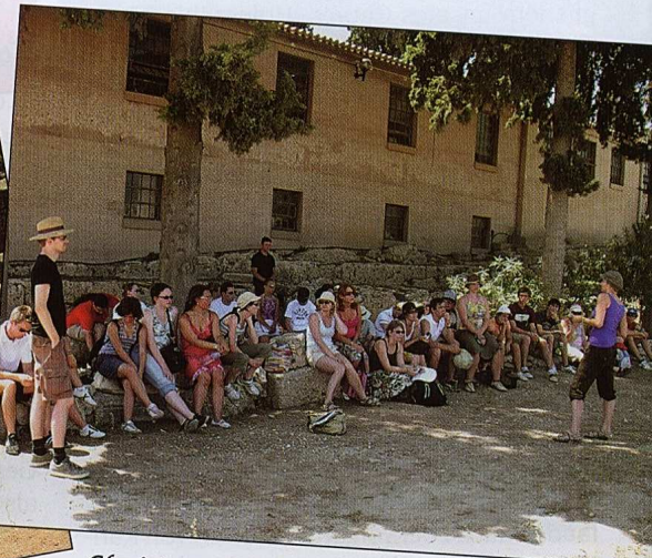
Chorinterne Reiseführung: Vortrag in Korinth