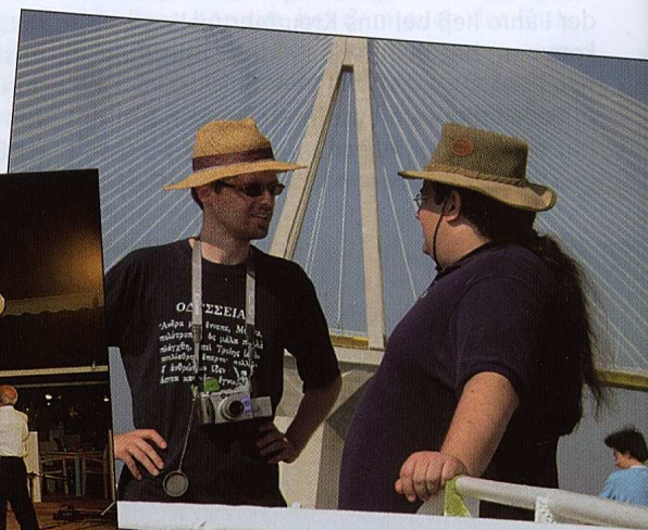
Unsere Organisatoren im Safari-Look