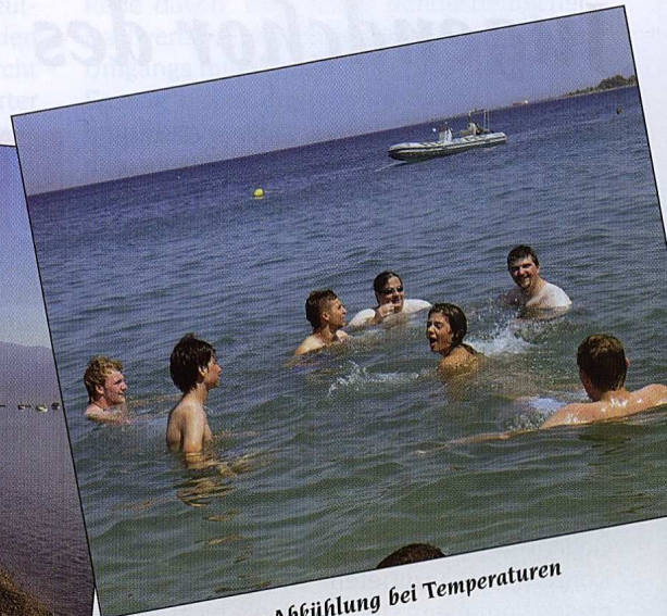
Willkommene Abkühlung bei Temperaturen über 30° Grad